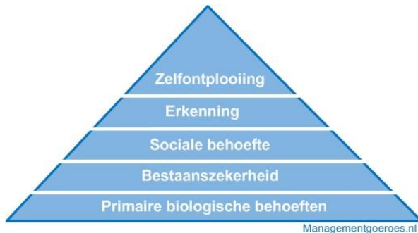
Figuur 1: behoeften hiërarchie

Wanneer een mens in de voorgaande vier behoeften is voorzien, kan er ruimte vrijgemaakt worden voor zelfontplooiing en je ontwikkeling als mens (Managementgoeroes, 2013).