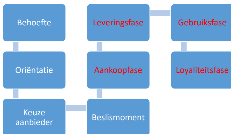
Figuur 2: customer journey